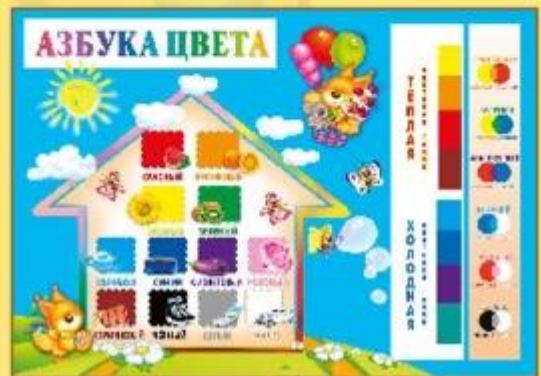
Плакаты и игры по изобразительной деятельности